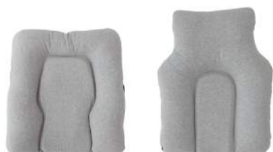
円背対応クッション(左:車椅子用 / 右:寝姿勢・座位用)

西川株式会社(本社:東京都中央区日本橋 代表取締役社長:西川ハ一行)では、“ゆとり”ある快適なシニアライフを送る方、サポートが必要な方、そしてサポートする方にも“優しさ”をプラスする、シニア世代に向けた寝具シリーズ『Good Night Plus(グッド ナイト プラス)』を展開しています。2019年1月からは新たに、同シリーズのケアラインとして介護を楽にする快眠サポートアイテムを発売。全国の百貨店(介護用品売り場)、寝具専門店にて展開しご好評いただいています。