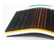
オリジナルスリット構造

オリジナルスリット構造で電動のリクライニングベッドにフィットし、ギャッチアップにも対応します。