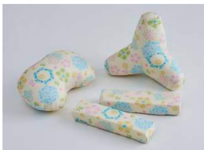
サポートクッション