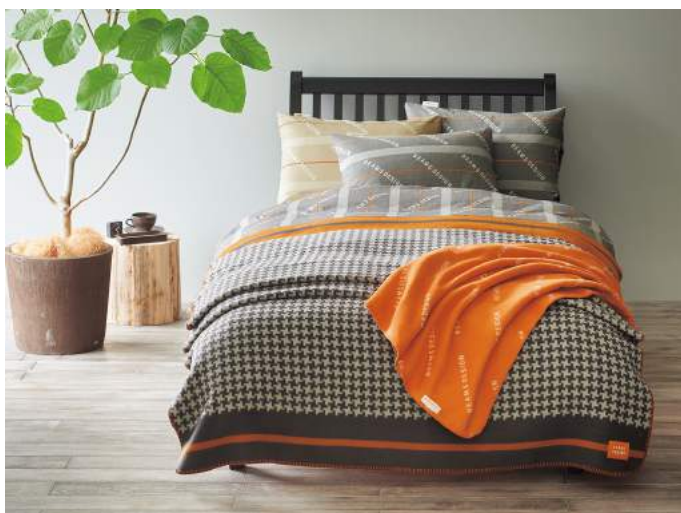
掛けふとんカバー (BM26) ¥10,000+税、ピローケース (BM26) ¥2,500+税 ウール毛布 (BM32) ¥20,000+税、綿毛布 (BM31) ¥8,000+税