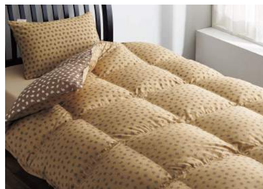
※GORE®, ゴア®は W. L. Gore & Associates の商標です。